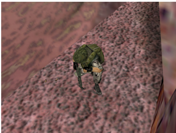
hl_marine.mp3 - Sound eines Marines

Die Geräusche einiger Gegner haben die Aufgabe dem Spieler die Position des Gegners zu verraten. Der Spieler weiss dadurch grob über die Position und Anzahl der Gegner Bescheid und kann seine Aktionen an die Situation anpassen. Der Typ Gegner der diese Art von Geräuschen produziert ist meistens einer der in grösseren Gruppen auftritt und der sich relativ eigenständig und dynamisch durch Räume bewegt.