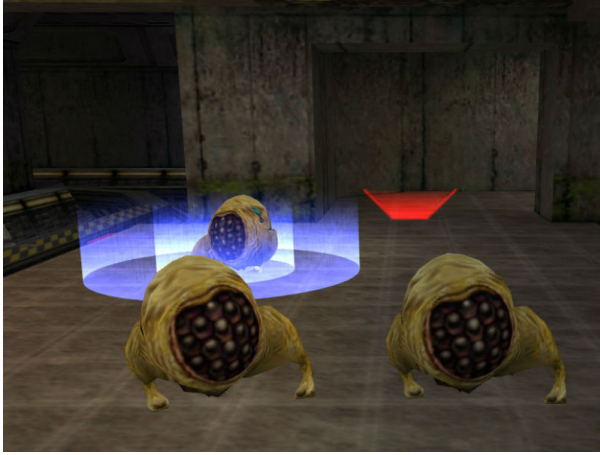
hl_hound.mp3 - Ein Houndeye führt seine Attacke aus.