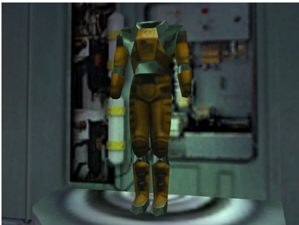
hl_hevsuit.mp3 - HEV Anzug Aktivierung

Gordon Freeman trägt einen HEV-Anzug, der ihn vor Verletzungen schützt. Dieser spricht gelegentlich und gibt kurze Informationen über Gesundheit und Zustand von Gordon.