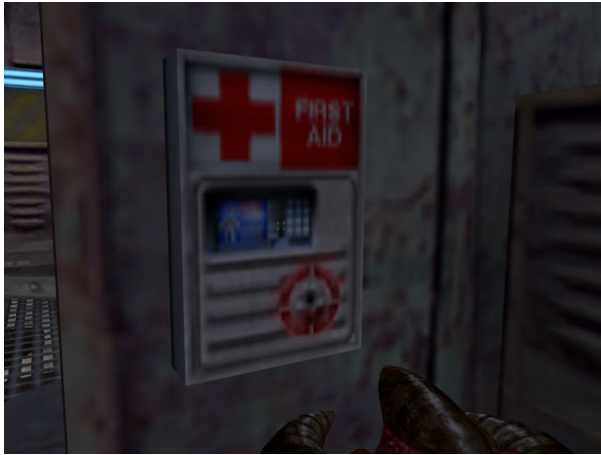
hl_automaton.mp3 - Aufladen des HEV-Anzugs mit