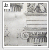
Vignola: Regola, 1607