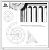
Vignola: Regola, 178?