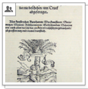
Blum: Von den funff Sulen, 1550