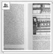
Cesariano: Vitruvio, 1521