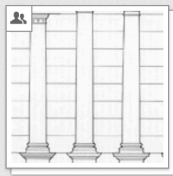
Chitham: Classical Orders, 1985