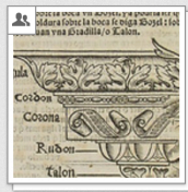
Sagredo: Medidas del Romano, 1526