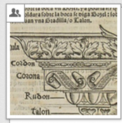
Sagredo: Medidas del Romano, 1526