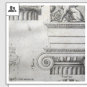
Vignola: Regola, 1607