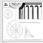
Vignola: Regola, 178?