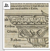
Sagredo: Medidas del Romano, 1526