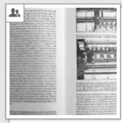
Cesariano: Vitruvio, 1521