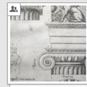
Vignola: Regola, 1607