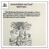
Blum: Von den fnf Sulen, 1550