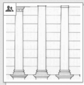
Chitham: Classical Orders, 1985