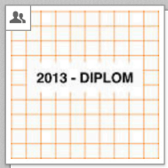
2013 - Diplom VID Industrial Design [Gruppe]