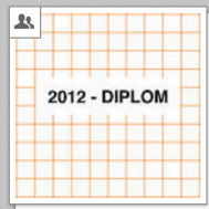
2012 - Diplom VID Industrial Design [Gruppe]