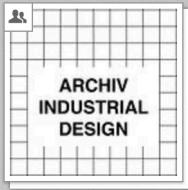
00 - ARCHIV INDUSTRIAL DESIGN Industrial Design [Gruppe]