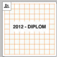
2012 - Diplom VID Industrial Design [Gruppe]