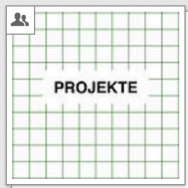
02 - Projekte VID [Gruppe], Industrial Design [Gruppe]