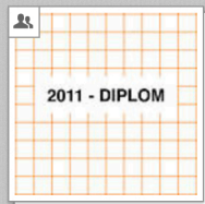
2011 - Diplom VID Industrial Design [Gruppe]