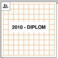
2010 - Diplom VID Industrial Design [Gruppe]