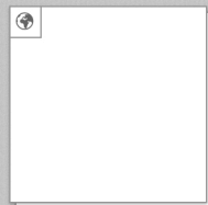
2007 Diplom VID Industrial Design [Gruppe]