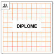
03 - Diplome VID Industrial Design [Gruppe]