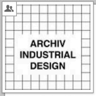
00 - ARCHIV INDUSTRIAL DESIGN Industrial Design [Gruppe]