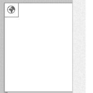
2008 Diplom VDI Industrial Design [Gruppe]