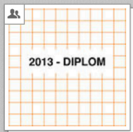
2013 - Diplom VID Industrial Design [Gruppe]