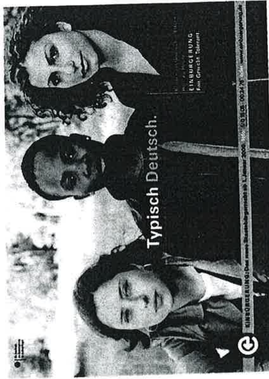
Abb. 3: © Hansen Kommunikation, Köln

system eine ambivalente, reifizierende Position für männliche Körper – und kein Teil des Darstellungskanons normativer Männlichkeitskonstruktionen. Gestützt wird die Objektivierung zudem durch die Passivität oder reaktive Abwehr konnotierenden Haltungen der dargestellten Körper – fünf der sieben Männer sind mit vor Bauch, Brust oder hinter dem Rücken verschränkten Armen und Händen dargestellt. Selbst wenn also Männlichkeit strukturell aktives Handeln zugewiesen ist, so wird diese Position im Fall der Bilder der Deutsche gegen rechte Gewalt -Kampagne durch den feminisierenden Darstellungsmodus unterlaufen. Ambivalent bleibt dieser Darstellungsmodus aber, da neben der Feminisierung ein anderer, auch durch Körperhaltung, dramatische Lichtregie und besonders durch das Casting der ethnisch markierten jungen Männerkörper aufgerufenen Code mitschwingt: jener der Hiphop- und Rap-Kultur, deren Bilder der dominanten Feminisierung schwarzer männlicher Subjekte bedrohlich inszenierte Hypermaskulinität entgegensetzen. Allerdings erfährt das Echo dieses Codes seine eindämmende Rahmung durch die Spektakularisierung der hier je einzeln vorgeführten (und darin die Signifizierung kollektiver Handlungsfähigkeit vermeidende) Männerkörper.