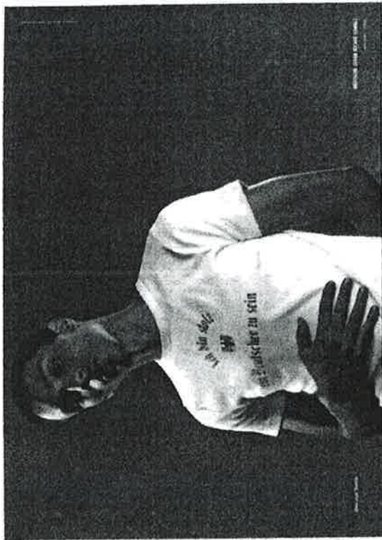
Abb. 4: © Scholz &amp; Friends, Berlin