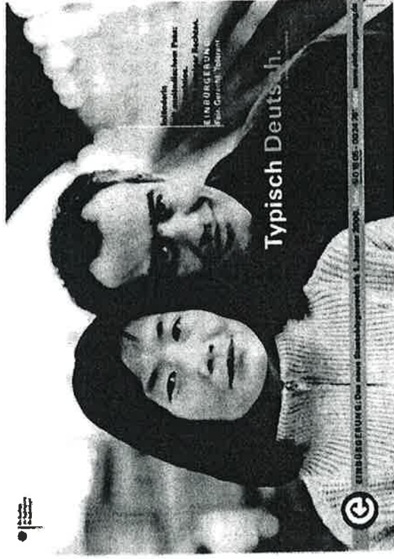
Abb. 1:

Jahren in Deutschland ); drei junge Frauen vor einer Parklandschaft ( Kinder ausländischer Eltern. Hier zu Hause. Einbürgerung: Fair. Gerecht. Tolerant. Typisch Deutsch. Vorfahren aus Warschau, Brazzaville und Istanbul ).